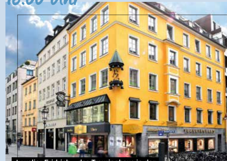
Juwelier Fridrich - das Trauringhaus in der Sendlinger Straße 15 in München.